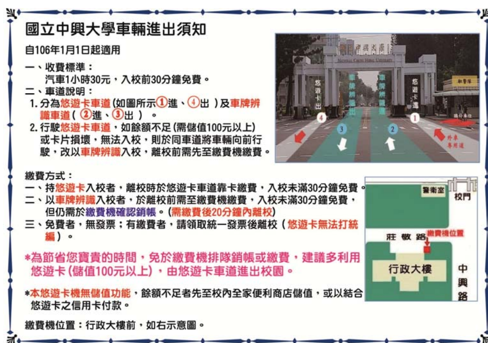
圖-3 入校停車進出及繳費說明

詳細資訊請參考 http://www.lib.nchu.edu.tw/index.php/map http://info.nchu.edu.tw/VehiclesPassage/VehiclesPassage.html