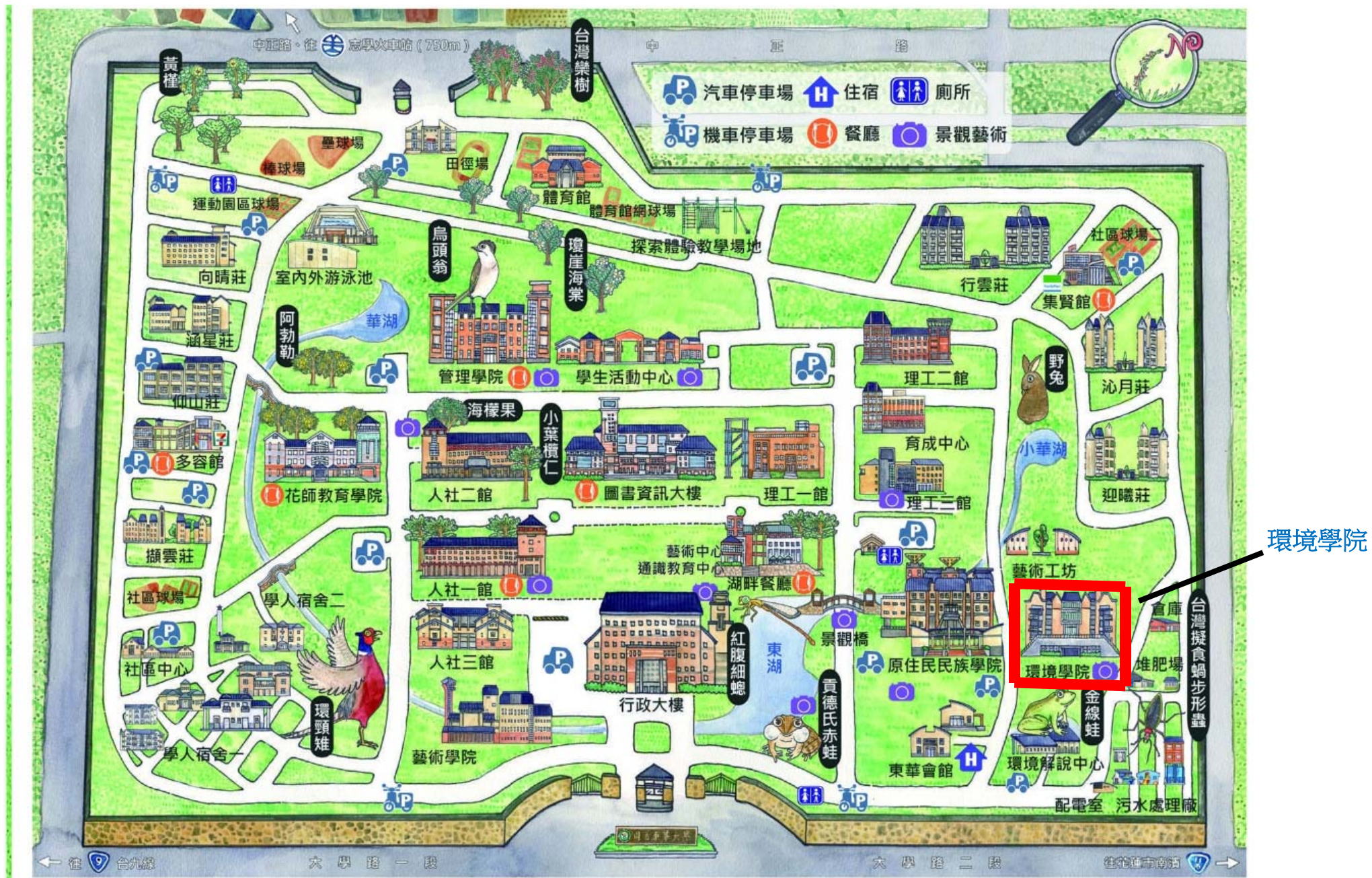
上課地點：環境學院校園位置示意圖