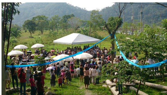
9/28 天人岩屋舉行的戶外婚禮