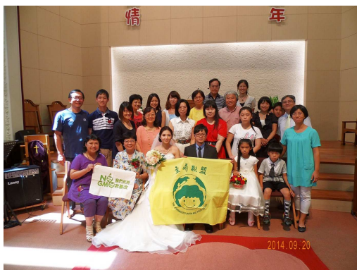
9/20 協會、日和與主婦聯盟伙伴合影